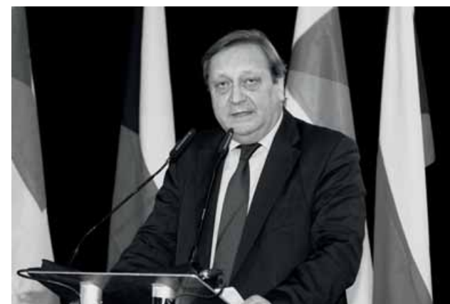
ALEXANDER KÁROLYI ombudsman Českého olympijského výboru

Informace o kompetencích ombudsmana ČOV a kontaktní údaje lze najít na webových stránkách: www.olympijskytym.cz/ombudsman-cov